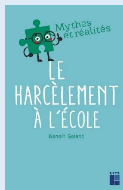
Son dernier ouvrage 2021

Benoît Galand a dirigé plusieurs enquêtes internationales sur le harcèlement scolaire. Ses travaux montrent que si le taux d'intimidation reste le même dans tous les établissements il varie cependant de façon très significative d'une classe à l'autre selon l'attitude adoptée par les enseignants